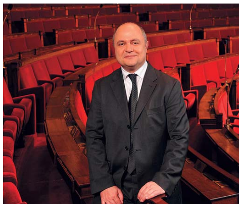
Bruno Le Roux Président du groupe SRC Assemblée Nationale

« Notre majorité est mobilisée pour remettre la France sur de bons rails. »